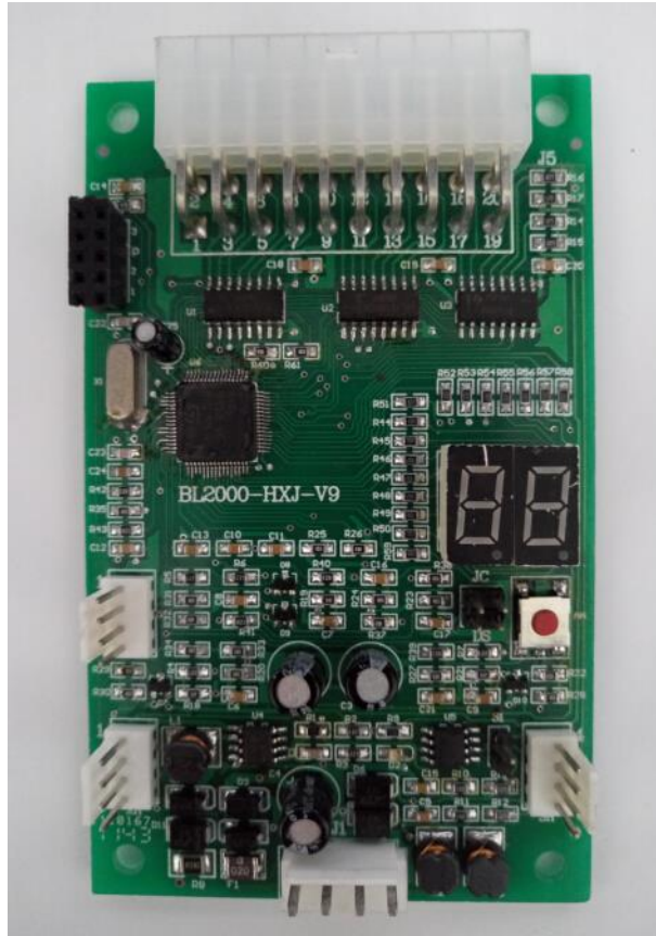
图 2.1 BL2000-HXJ-V9 实物图